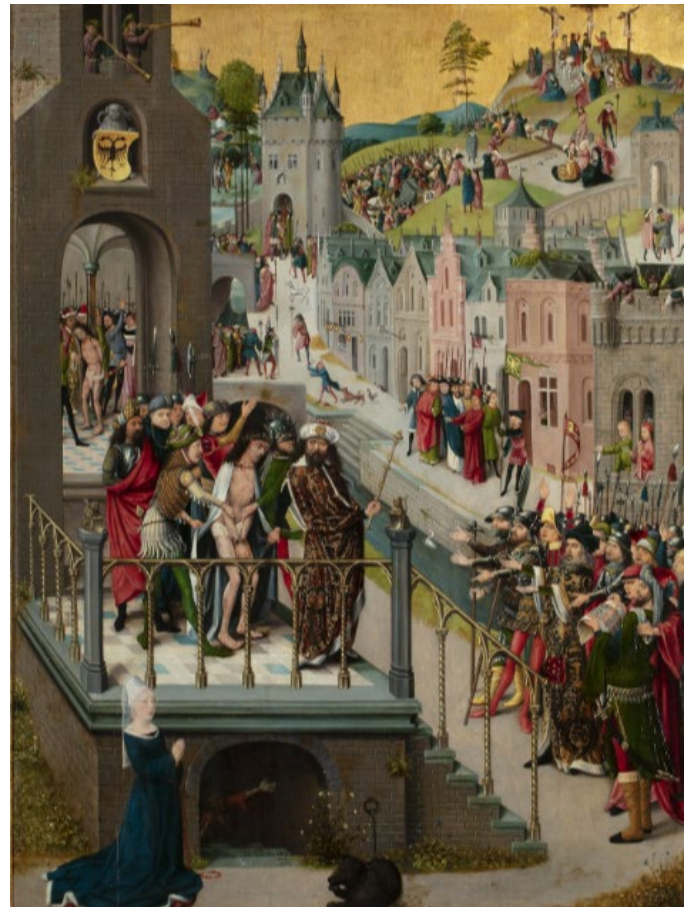
Ecce homo, ca. 1480, maker onbekend

Feesten horen ook bij de tradities: we herdenken op vaste momenten wat er gebeurd is. Laat de leerlingen de betekenis van een favoriet feest uitzoeken en bespreek dit samen. Omdat veel feesten uit de christelijke traditie komen, en de feesten altijd gezamenlijk (in de kerk) gevierd werden, zijn dit vaste vrije dagen geworden in Nederland.