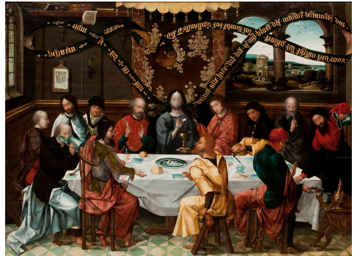
Laatste avondmaal, 1515-1524, Meester van 1518