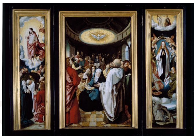
Drieluik met Nederdaling van de Heilige Geest, Hemelvaart van Christus en Maria Tenhemelopneming. Omgeving van Lucas van Leyden, tweede kwart 16e eeuw ABM s114

► Dit schilderij gaat over Pinksteren. Zie je de vlammetjes boven de hoofden van de apostelen? Wat kun je nog meer ontdekken op het schilderij?