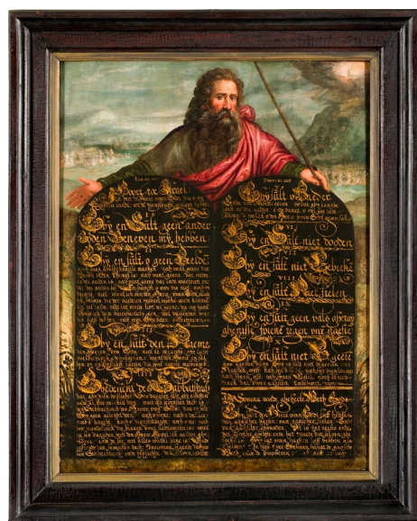
Tiengebodenbord met Mozes Noordelijke Nederlanden, eerste kwart 17e eeuw RMCC s13